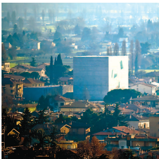
La Chiesa di San Giacomo a Foligno, progetto di Massimiliano Fuksas. Il cubo è "un landmark inaspettato e alieno da osservare da lontano", dice il progettista. L'edificio rientra in un progetto di ricostruzione a seguito del sisma che ha colpito l'area nel 1997.

Di recente è stata pubblicata, dalla Libreria Editrice Fiorentina, un'importante e godibile raccolta di scritti di Nikos Salingaros, contornata dagli interventi di altri rilevanti protagonisti di un dibattito che travalica la problematica urbanistica ed architettonica per coinvolgere questioni assolutamente fondamentali quali la bellezza, il nichilismo e il rapporto tra intellettuali e potere. Risalendo nella storia dell'interessamento della piccola e raffinata casa editrice cattolica a queste tematiche, bisogna tributare altrettanto merito a Stefano Borselli e al suo Covile - un pezzo di cultura fiorentina nel web - senza il quale il pensiero di Salingaros avrebbe impiegato chissà quanti anni ancora prima di giungere in Italia.