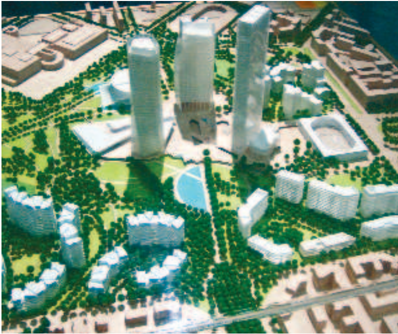
Progetto "Citylife" per la riqualificazione dell'area ex-Fiera di Milano, proposto da Daniel Libeskind, Zaha Hadid e Arata Isozaki, in cui si prevede la realizzazione di tre grattacieli: una vela di 170 metri (Libeskind), un grattacielo attorcigliato su se stesso e alto 185 metri (Hadid) e un parallelepipedo di 215 metri, di Isozaki.

indici fisiologici di stress (battito cardiaco, espansione delle pupille) davanti a questo tipo di forme, sono dati misurabili oggettivamente, e i loro riscontri soggettivi e sociali (inquietudine, violenza urbana) possono venire sottoposti a misurazioni statistiche. Ma le forme aliene hanno in più la capacità di infettare le menti. Gli uomini ne assorbono la discordia, e mediante il nuovo "gusto" programmato divengono i veicoli della loro riproduzione.